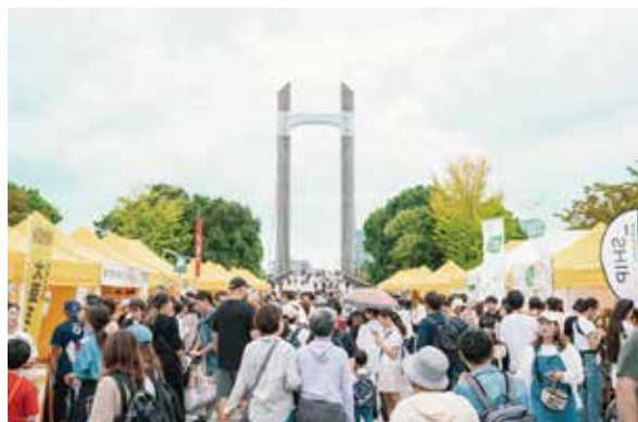
東京会場 2024 秋の様子

* 代理店を通した出店であっても、「出店名」が対象企業名であれば、協賛出店の対象となります。