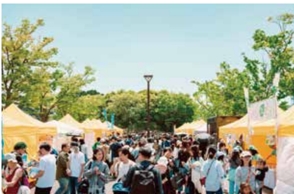
京都会場 2025 春の様子