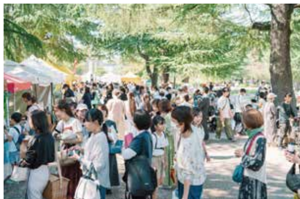
名古屋会場 2024 秋の様子