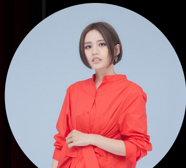
創作歌手與海 吳汶芳