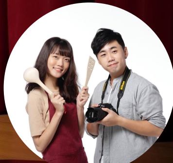
無肉生活飲食入門 野菜鹿鹿