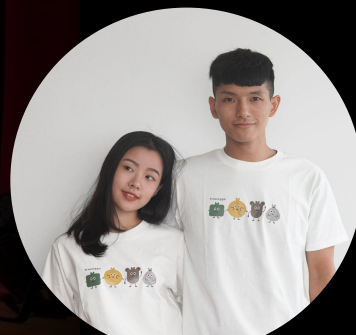
力量，從改變而來 找蔬食