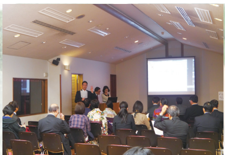
㊤協会主催の東京講演会・セミナー ㊦協会後援の京都ビーガングルメ祭り