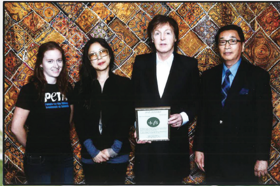
2013年の来日の際、ミートフリー・マンデーの社会的貢献により、協会賞を贈った