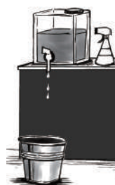
給水タンク & 受けバケツ